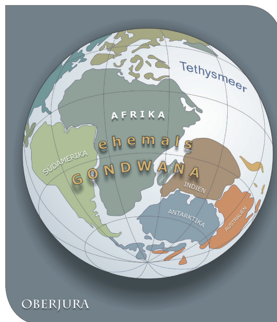
Abb. 2: Plattentektonische Situation im Oberjura, vor ca. 150 Mio. Jahren, zum Zeitpunkt des Aufbrechens Gondwanas. Mit dem Einströmen des Tethysmeeres in die entstehende Grabenzone zwischen Madagaskar und Ostafrika kommt es zur Ablagerung organisch-reicher Tonsteine.

Extensiver Vulkanismus am Ende der Karoo-Abfolge markiert den beginnenden Zerfall Gondwanas im frühen Jura. Madagaskar löste sich zusammen mit Indien vom afrikanischen Kontinent und wurde entlang einer großräumigen Blattverschiebungszone nach Süden geschoben. Die damit verbundene Dehnung führt zur Entstehung